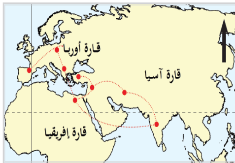
شكل (2) خط سير العجر من الهند الى أوروبا